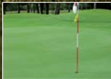
Greengeschwindigkeit . . . Seite 7