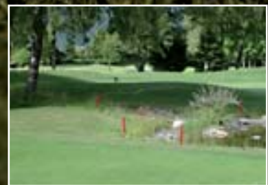
CSA – Faire Ergebnisse? Seite 21