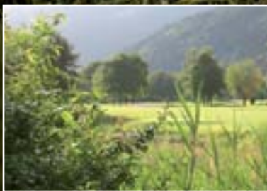
43. Ordentliche Mitgliederversammlung Seite 4